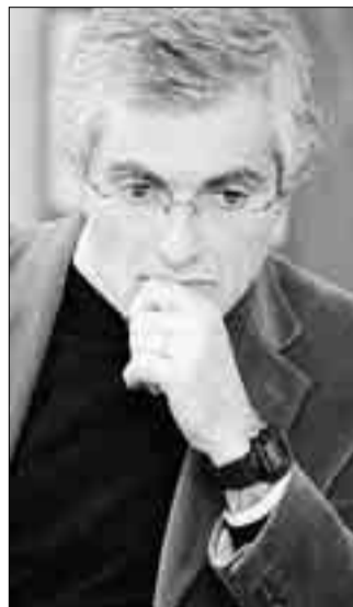
Davide Paris, presidente nazionale della Federazione dal 2004 al 2006. Vive a Martignano