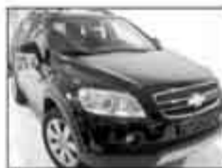
Chevrolet Captiva LTX 2.0 Vcdi 18v 7 posti nero met., Computer di bordo, Cerchi in lega 18", Cambio automatico, Interni in pelle, Ferdiviebbis. PRONTA CONSEGNA