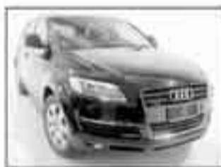
Audi Q 7 Tdi 3.0 V6 Quattro nero met., Adaptive Air Sospens. Navi plus Dvd Climatronic 4 zone, Antifurto tempomat. PRONTA CONSEGNA