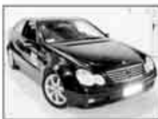
Mercedes C220 CDI Sportcoupè nero met, radio cd, tempomat, cerchi in lega da 17, Esp, imm 03/2004. Listino 34.400" Euro 20.600