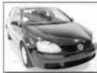
Volkswagen Golf 1.9 tdi Nero met. 6 marce climatronic, 4 vetri elettrici, Erip Specchi est. elettr. e riscaldati, Controllo pressione gomme servotronic. Listino 23.227" Euro 18.400