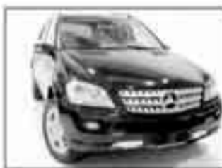
ML 320 CDI Sport nero met. far bi-xeno, Keyless-Go, Tetto apribile, Pack Offroad, Comandi, Cerchi in lega da 19, Sensori parcheggio. PRONTA CONSEGNA