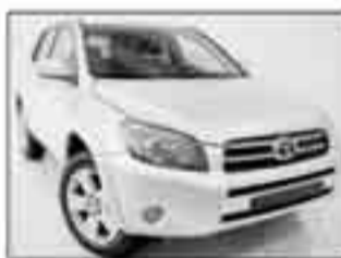
Toyota Rav 4 D4-D 177cv Luxury argento met., int. pelle climatronic, cerchi in lega da 18", Smart Entry & Smart tempomat. PRONTA CONSEGNA