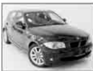
BMW 118 d Eletta nero met., cerchi da 17", faro allo xeno, chilometri zero Listino 30.700" Euro 27.950