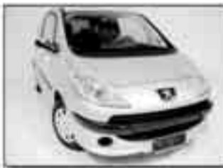
Peugeot 1007 1.4 HDi Happy Argento met. Climatizzatore, Vetri elettrici, Chiusura centralizzata con telecomando, Predisposizione radio. PRONTA CONSEGNA