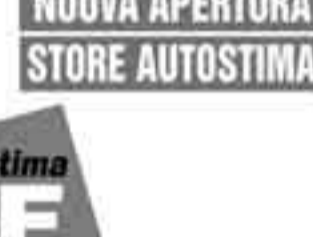
Renault Megane 1.9 dCi Luxe Dynamique Argento met. clima automatico, radio cd, cerchi in lega da 17, vetri elettrici, computer di bordo, imm. 2004. Listino 22.150" Euro 11.300